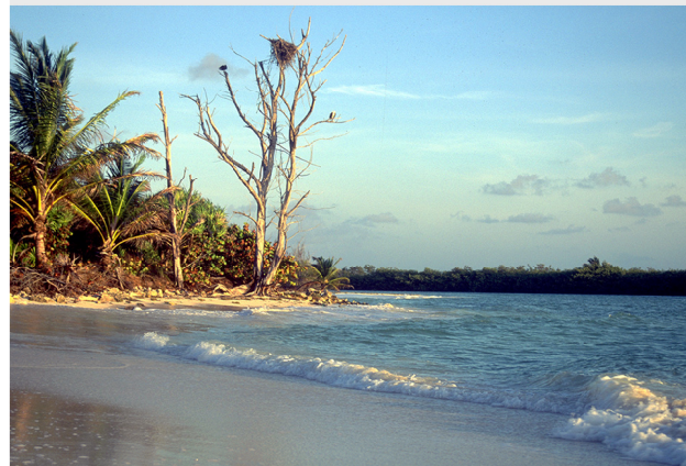
Reserva de la Biosfera Sian Ka'an, México Adyacente al Sistema Arrecifal Mesoamericano, esta reserva contiene humedales intactos.

Respondiendo a las amenazas del desarrollo costero, el turismo irregulado y la agricultura y pesca insostenibles, los socios de ICWRP desarrollaron un proyecto para proteger hábitats costeros críticos. A través del programa de conservación de compra de tierras en áreas costeras alrededor de la reserva, ICWRP ha asegurado la protección de un trayecto vital de tierra que protege el único acceso a un sistema extensivo de humedales en la región.