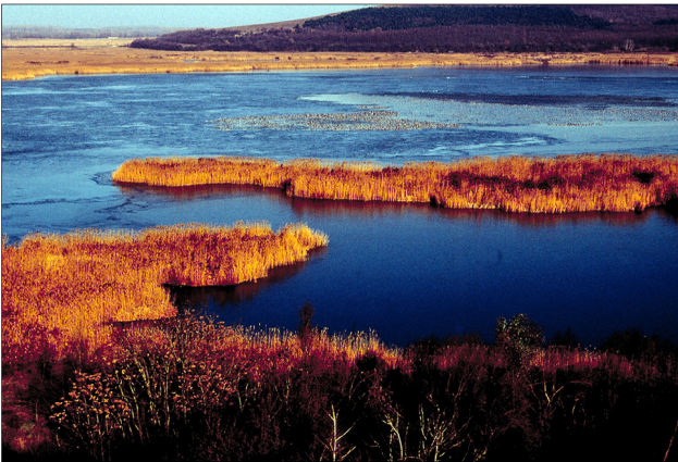
Reserva Natural Srebarna, Bulgaria La construcción de represas amenaza con alterar la vida silvestre de esta extensa zona de humedales.

Sin embargo, en los últimos 200 años, hemos perdido más de la mitad de nuestros humedales a nivel mundial, poniendo así en peligro la salud ecológica de nuestras áreas costeras.